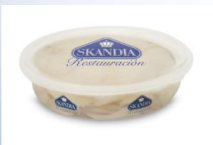
BACALAO AH. 650g CÓDIGO: 03336