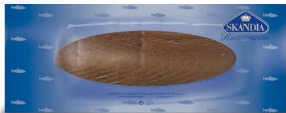
ATÚN AHUMADO EN TACO AH. PESO VARIABLE CÓDIGO: 02510