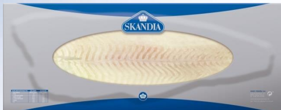
BACALALO AH. P/C SKANDIA CON PIEL CÓDIGO: 03313