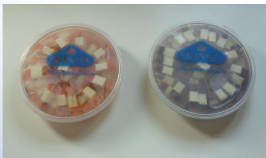
BANDERILLAS SALMÓN AH. Y QUESO 370g CÓDIGO: 01069 BANDERILLAS ATÚN AH. Y QUESO 370g CÓDIGO: 02569