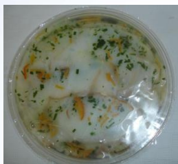
BACALAO AH. A LA NARANJA 380g CÓDIGO: 03337