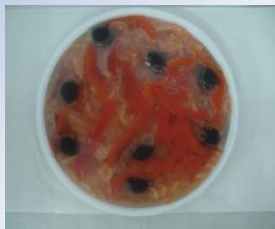
SALPICÓN DE AHUMADOS 410g CÓDIGO: 01644