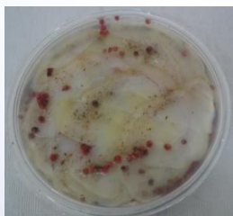
BACALAO AH. A LAS 5 PIMIENTAS 380g CÓDIGO: 03338