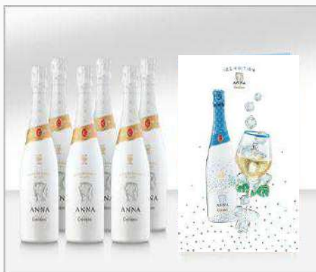
Caja Anna BdB + Libro Reserva 2.000 CAS