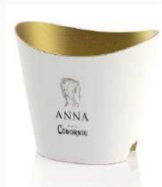
Cubitera 3 bot. Rediseño nueva botella