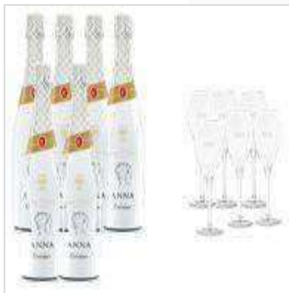
Caja Anna BdB + 6 copas 2.900 CAS