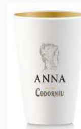
Cubitera 1 bot. Rediseño nueva botella