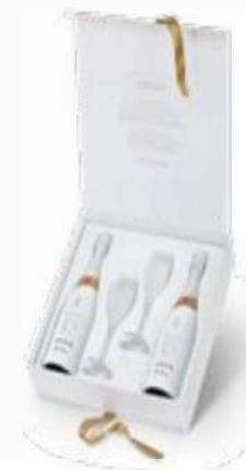
Estuche tienda especialista 1.200 CAS